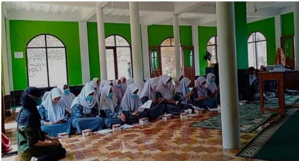
Peserta kegiatan edukasi dan penyuluhan kesehatan siswa/i MTs Al Irfan, Tanjungsari Kabupaten Sumedang.

SAMPAH adalah barang atau benda yang berasal dari kegiatan manusia yang sudah tidak terpakai lagi atau tidak dapat digunakan lagi. Nasib sampah umumnya dianggap sebagai barang buangan sehingga akan dibuang ke lingkungan. Pembuangan sampah ke lingkungan secara terus menerus oleh masyarakat dapat menyebabkan berbagai permasalahan lingkungan, sosial dan kesehatan.