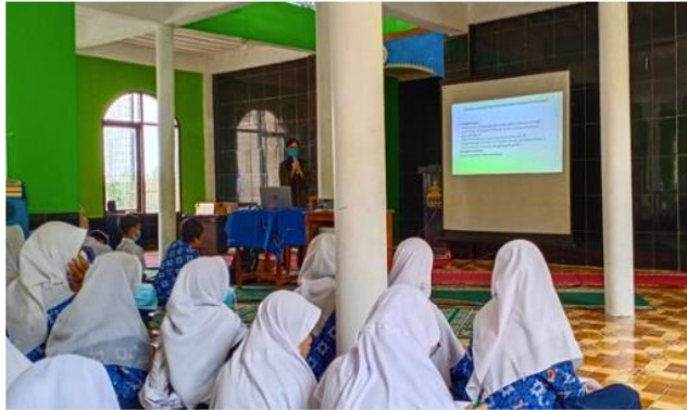
Kegiatan edukasi dan penyuluhan kesehatan siswa/i MTs Al Irfan, Tanjungsari Kabupaten Sumedang

SAMPAH dan pengelolaannya merupakan masalah global di seluruh dunia, termasuk Indonesia. Data Sistem Informasi Pengelolaan Sampah Nasional (SIPSN) tahun 2021 menunjukkan bahwa produksi sampah nasional adalah sekitar 23.23 juta ton/tahun. Dari angka ini baru 49.49% yang dapat dilakukan penanganan, serta 63.38% yang dapat terkelola. Meskipun regulasi pengelolaan sampah telah diatur dalam berbagai peraturan, mulai dari peraturan pemerintah, Menteri dan daerah, namun hingga saat ini permasalahan pengelolaan sampah masih menjadi 'PR' di berbagai daerah, salah satunya adalah Kabupaten Sumedang. Hal ini dapat terlihat dari data pengelolaan sampah tahun 2021 pada situs halaman SIPSN yang menunjukkan bahwa besarnya pengurangan sampah dari timbulan yang ada di Kabupaten Sumedang masih 4.11%, sedangkan prosentase penanganan sampah per tahun masih sebesar 26.72%. Melihat data yang ada ini, maka perlu dilakukan berbagai upaya yang melibatkan masyarakat dalam pengelolaan sampah, agar lebih cepat dan luas dampaknya bagi pengelolaan sampah di daerah tersebut.