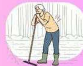
Status sosial ekonomi rendah