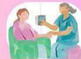
Penyakit medis kronis