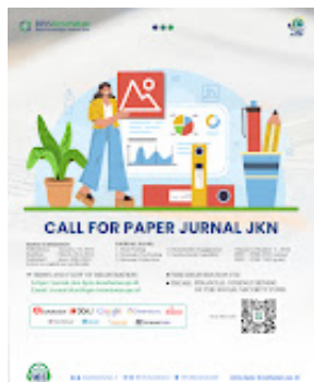
flyer call for paper V4N1 Tahun 2024.jpg 1615K

-- This message has been scanned for viruses and dangerous content by MailScanner , and is believed to be clean.